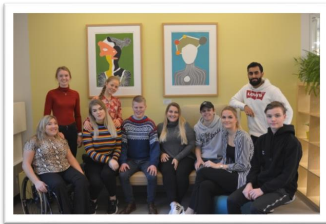
Ungdomsrådet desember 2018