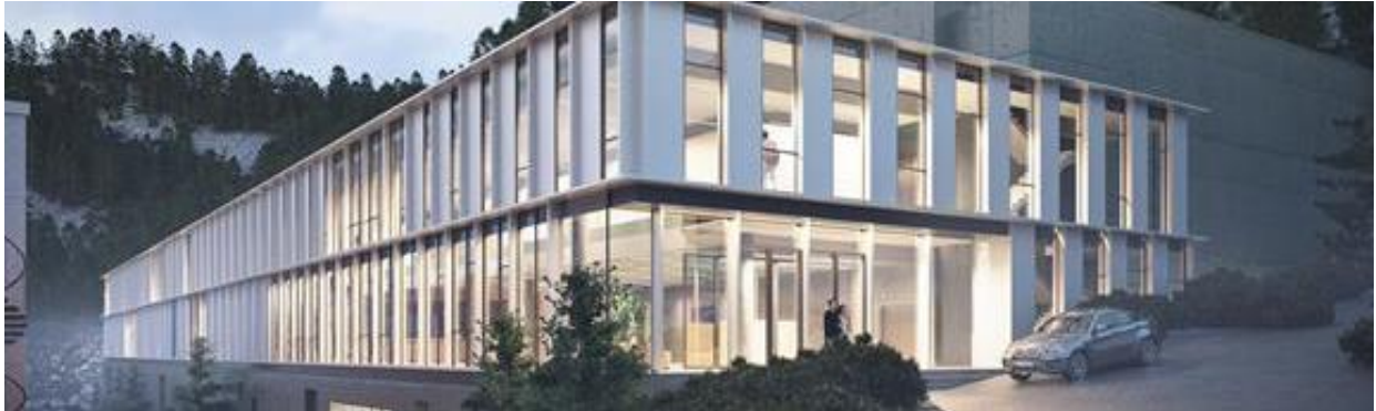
Protonsenteret skal byggas i Haukelandsbakken rett over Ulriksbanen sin nedre stasjon. Illustrasjon: Arkitema Architects