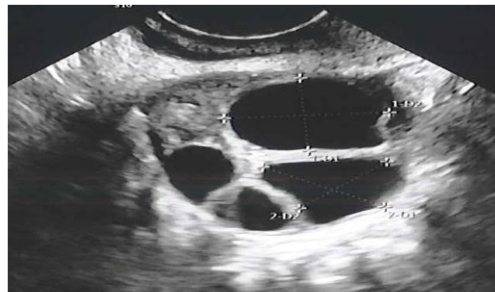
Follikelstørrelse: Lengde + bredde /2.