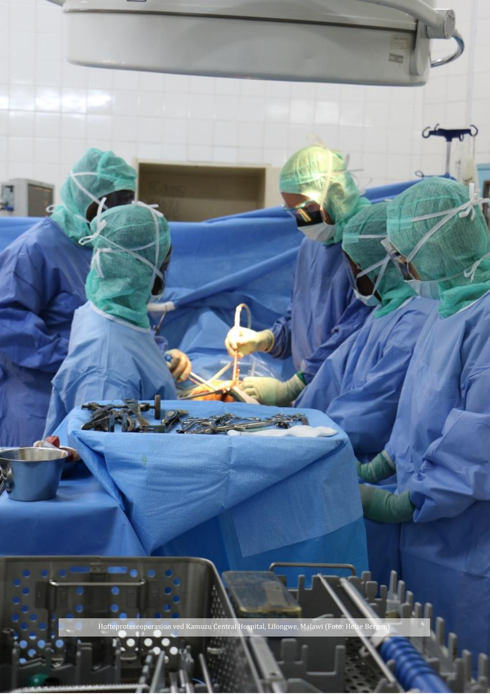
Hofteproteseoperasjon ved Kamuzu Central Hospital, Lilongwe, Malawi