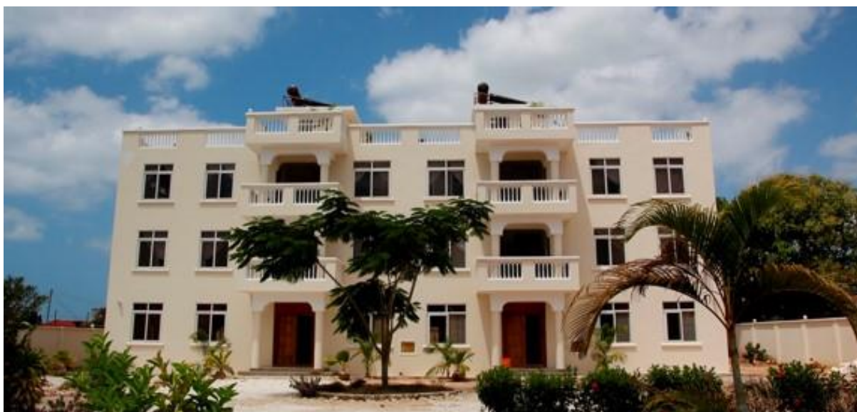
Haukeland House på Zanzibar

Bygget i India kosta ca 650,000 kr og er nedbetalt, mens det på Zanzibar hadde ein kostnad ca. 3,2 mill kr. Der står det att ca. 1,5 mill kr å nedbetale.