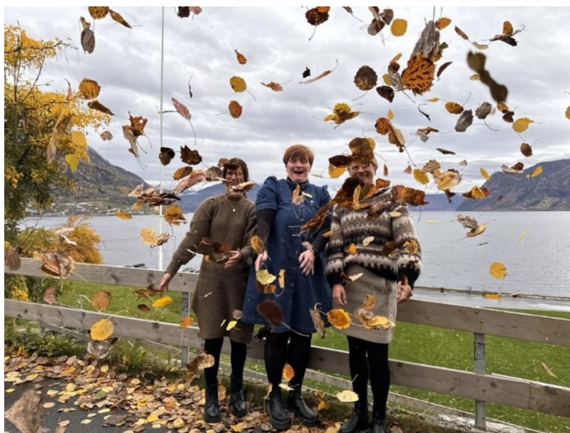
Bilde tatt på nettverkssamling i Leikanger.

Det var totalt 59 av 89 ressursjukepleiarar som møtte på nettverksamlingane som er fordelt på 3 nettverksgrupper.